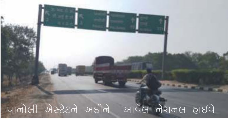
પાનોલી એસ્ટેટને અડીને આવેલ નેશનલ હાઇવે