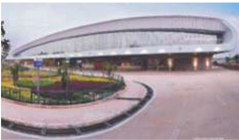
Vadodra Domestic Airport