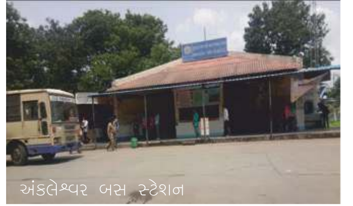
અંકલેશ્વર બસ સ્ટેશન

પાનોલી ઈન્ડસ્ટ્રીયલ એસ્ટેટ નેશનલ હાઇવે નંબર આઠ ઉપર આવેલું છે. અંકલેશ્વરથી સાત કિલોમીટરના અંતરે આવેલ એસ્ટેટ નેશનલ હાઇવેની પશ્ચિમ દિશામાં હાઇવેને સમાંતર પાંચ કિલોમીટર લંબાઈમાં પિક્સેલ છે. પાનોલી એસ્ટેટ અંકલેશ્વરથી ઉત્તરે સાત કિલોમીટરના અંતરે તેમજ સુરતથી દક્ષિણે ૪૦ કિલોમીટરના અંતરે આવેલ છે.