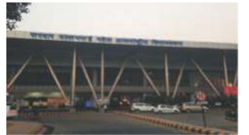
Ahmedabad International Airport

અમદાવાદ ઈન્ટરનેશનલ એરપોર્ટ પાનોલીથી ૨૧૦ કિલોમીટરના અંતરે આવેલ છે. જ્યારે વડોદરા એરપોર્ટ ૧૧૩ કિલોમીટરના અંતરે આવેલું છે. જ્યારે સુરત એરપોર્ટ ૭૨ કિલોમીટરના અંતરે છે.