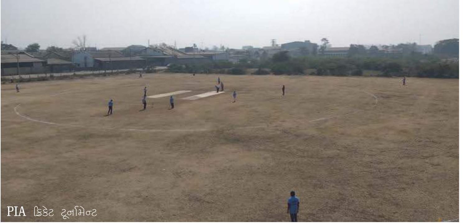
PIA ક્રિકેટ ટૂર્નામેન્ટ