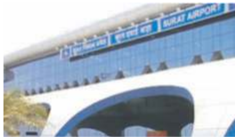
Surat Domestic Airport